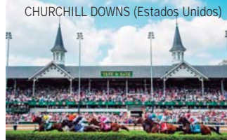
CHURCHILL DOWNS (Estados Unidos)

Las carreras de caballos son uno de los hobbies más exclusivos de los últimos tiempos. No solo la carrera en sí como espectáculo o la emoción de la apuesta: aquí entran en juego un montón de cosas, cÓmo el aire festivo en torno a la carrera o el gusto por vestir ropa elegante.